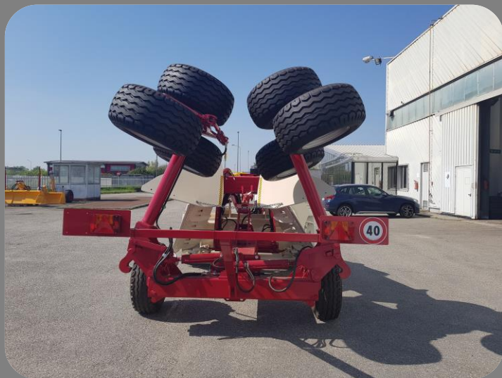
Assale a farfalla chiuso